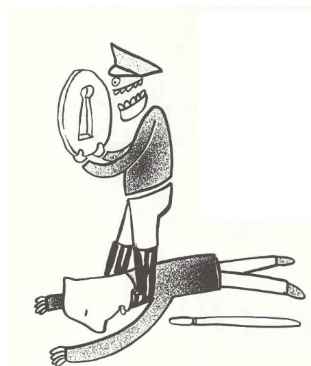
Tegning: Peter Lautrop

og en ikke fyldestgørende definition af tortur i straffeloven."